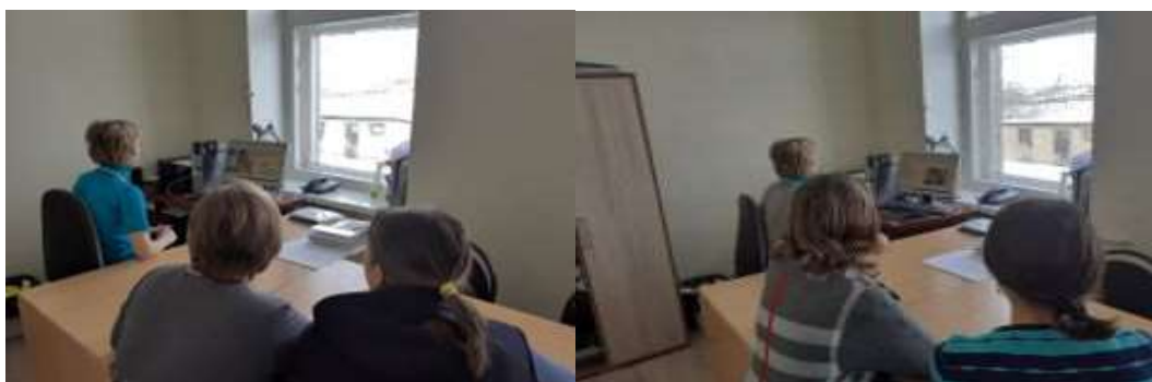
«Как сохранить голос здоровым»